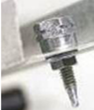
금속 스크루드릴링 시 비트홀더 + 스크루 비트