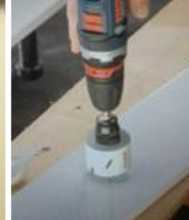
사전 드릴링 시 드릴 비트