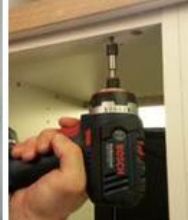
목재 스크루드릴링 시 비트홀더 + 스크루 비트