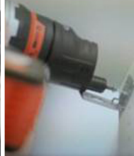
모서리 작업 시 스크루 비트