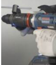
해머 드릴링 시 SDS-Plus 드릴 비트